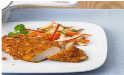
Paniertes Fischfilet mit frischem Gemüse und Kartoffeln